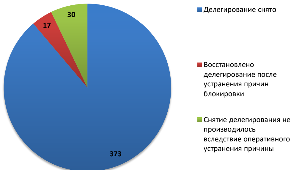
Рис.3 Итоги обработки обращений о снятии делегирования (июнь 2018)

За отчетный период по обращениям компетентных организаций были сняты с делегирования 390 доменных имен *) . Для 30 доменных имен снятие делегирования не потребовалось вследствие оперативного устранения причин блокировки администратором домена (или ресурс был заблокирован хостинг-провайдером).