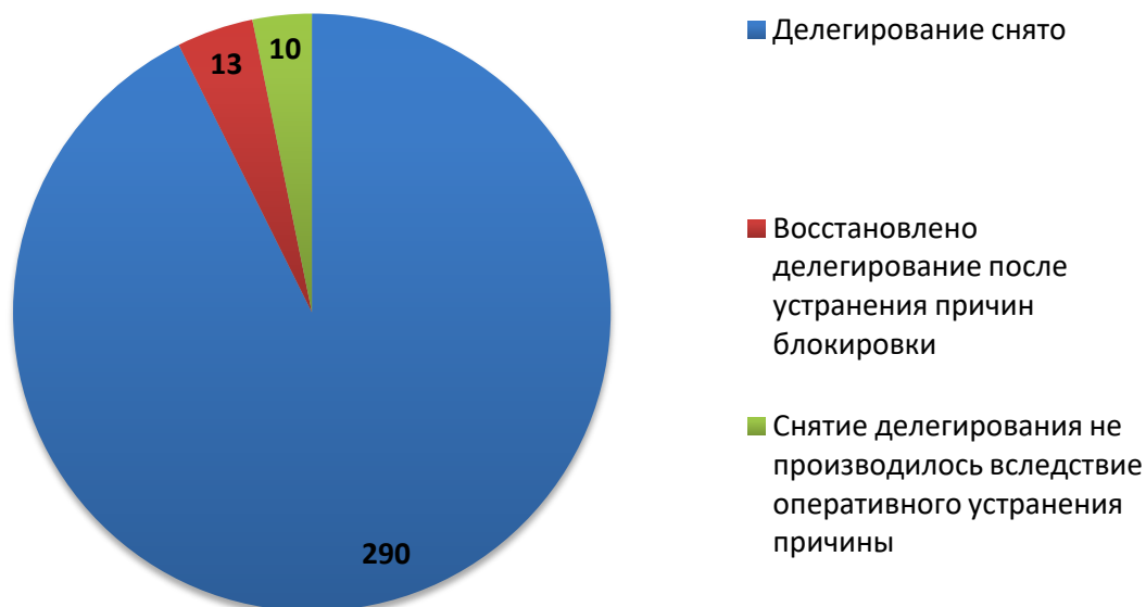
Рис.3 Итоги обработки обращений о снятии делегирования (апрель 2018)

За отчетный период по обращениям компетентных организаций были сняты с делегирования 303 доменных имени. Для 10 доменных имен снятие делегирования не потребовалось вследствие оперативного устранения причин блокировки администратором домена (или ресурс был заблокирован хостинг-провайдером).